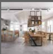
Éttermekben és szállodák előtereiben Restaurants and Hotel lobbies