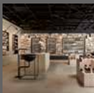
Kereskedelmi területeken Commercial areas