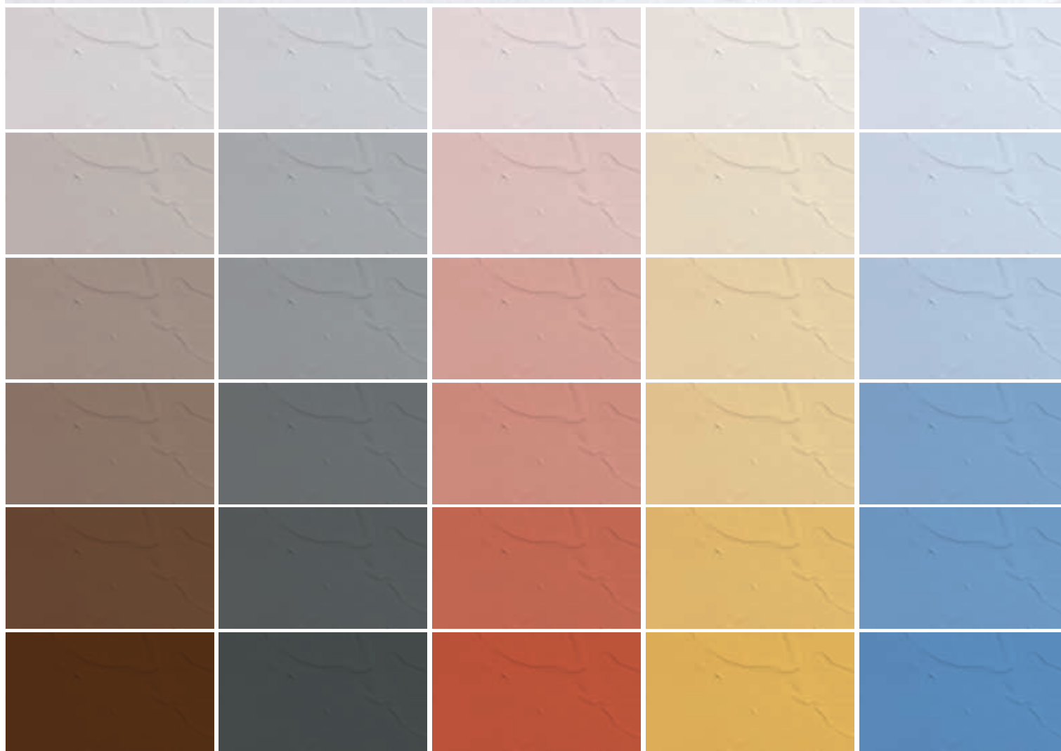
Ultratop Color Paste Barna Brown