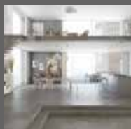
Lakókörnyezetben Residential settings