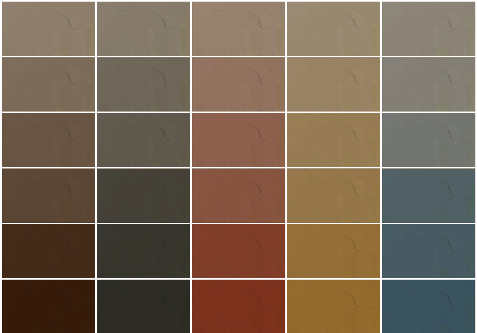
Ultratop Color Paste Barna Brown